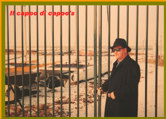
Tony, nog aan de verkeerde kant van de tralies ?

locatie tot zeven ( Kees Wolters / Horst Weipert ).